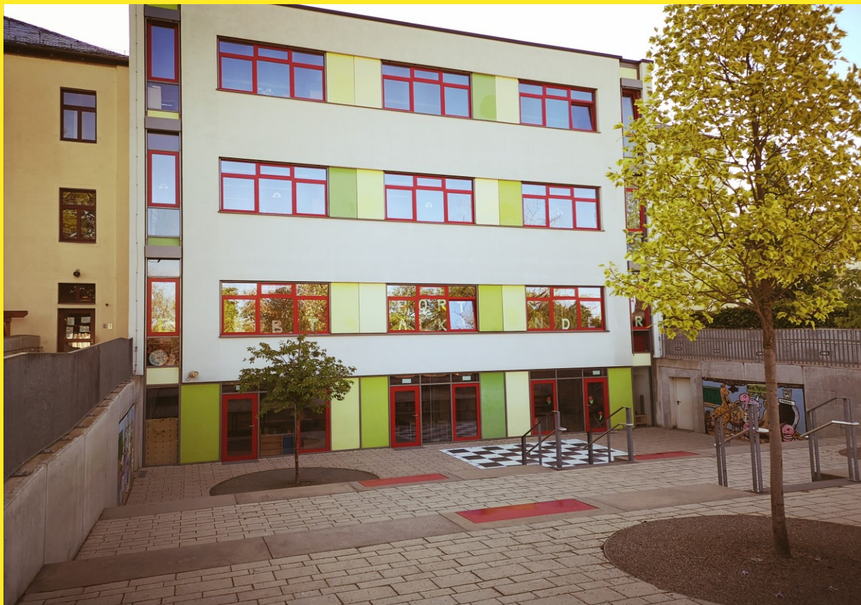
Hort 41. Grundschule „Elbtalkinder“